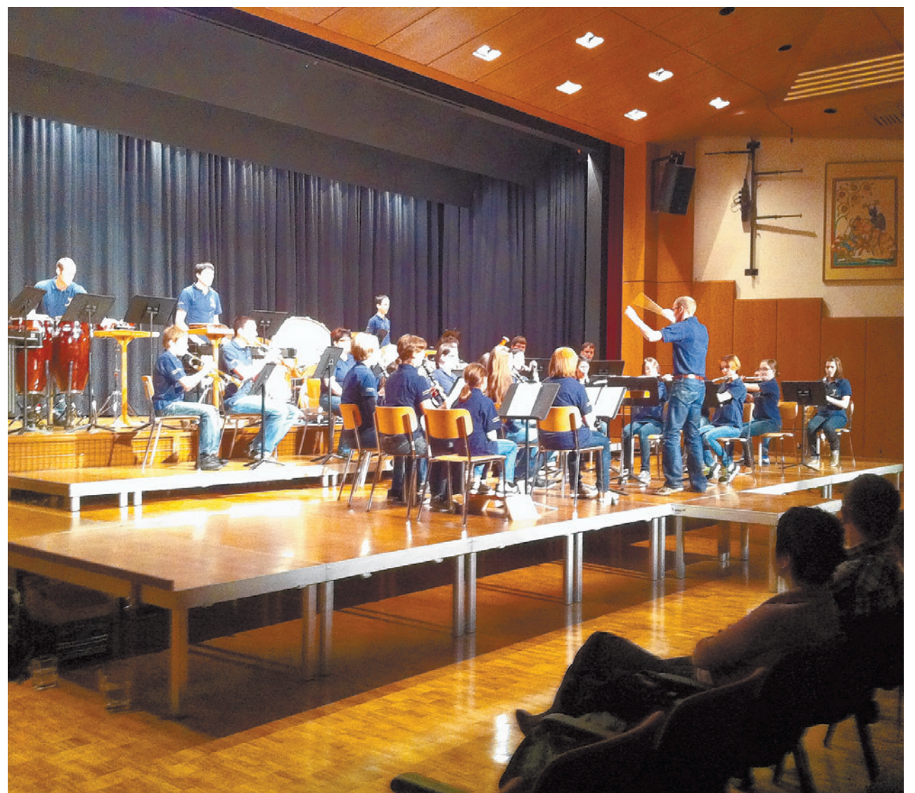
Erlertes umgesetzt: Das Abschlusskonzert bildet jeweils den Höhepunkt des Jungmusikantenlagers.

BALZERS Am vergangenen Sonntag stellten die Balzner Jungmusikanten ihr Erlertes unter Beweis. Das Abschlusskonzert des 34. Jungmusikantenlagers der Harmoniemusik Balzers fand im Gemeindesaal Balzers statt.