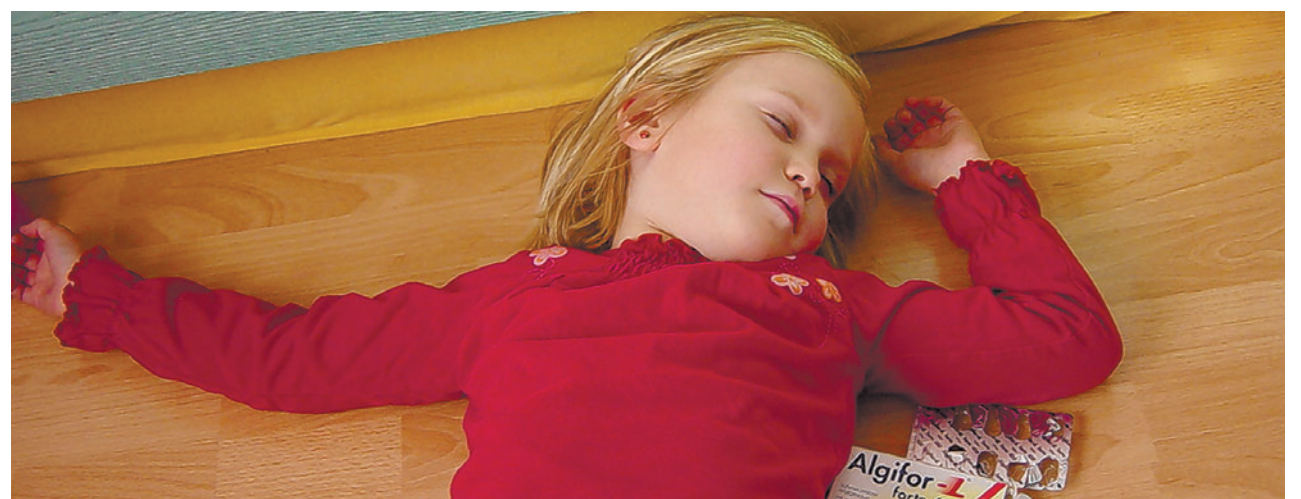
Der Samariterverein Triesen möchte Ihnen helfen, in einer Notsituation richtig zu handeln. Deshalb veranstalten wir den Kurs «Notfälle bei Kleinkindern» für alle Eltern, Grosseltern und Betreuer von Kleinkindern.

Kursabende: Jeweils am Montag: 17. Oktober; 24. Oktober und 7. November Zeit: An den ersten beiden Abenden von 19 bis 22 Uhr, am letzten Abend von 19 bis 21 Uhr Kosten: Einzelpersonen zahlen 90 Franken, Ehepaare 150 Franken Ort: Samariterlokal Triesen